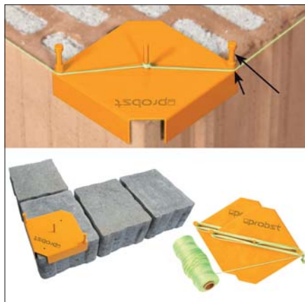
oben: für Mauerwerk, unten: für Pflaster, Platten und Bordsteine