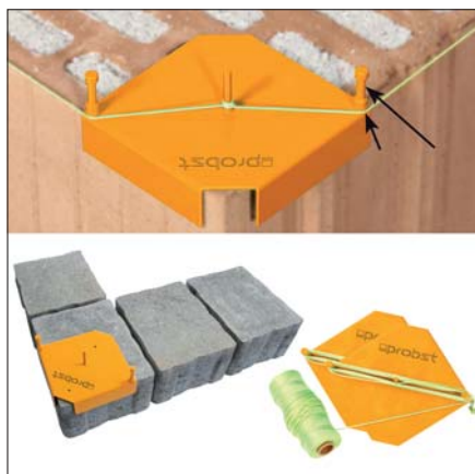
En haut : pour maçonnerie, en bas : pour pavés, dalles et bordures