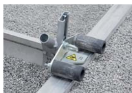
Jea de rouleaux TP/FP-RS